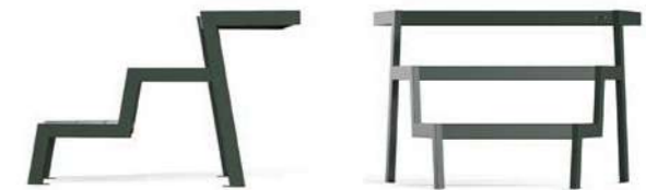
ESPRIT - K

Three-level modular seat with a trapezoidal shape consisting of two tubular steel supports onto which three seats with shaped WPC slats are mechanically fixed at different heights. All metal parts are galvanised and coated with thermosetting polyester powder. All fixings are in AISI304 stainless steel. Prepared with holes for ground fixing through mechanical dowels (not included).