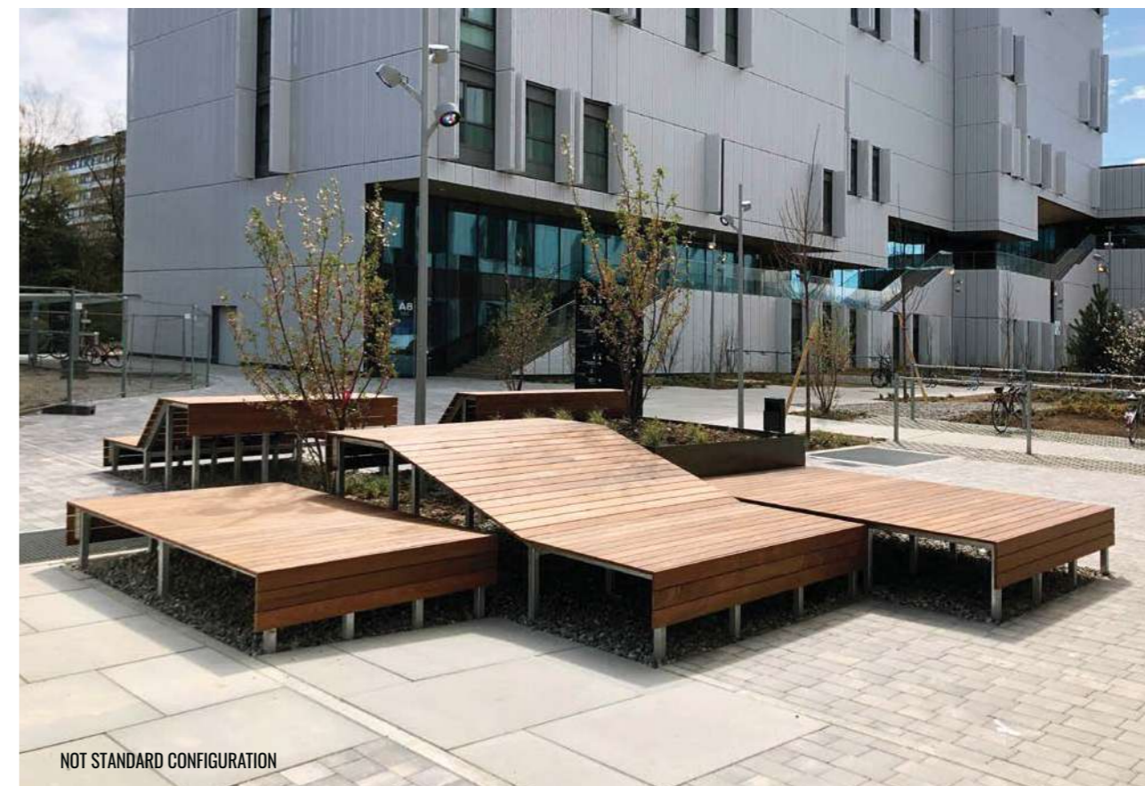
NOT STANDARD CONFIGURATION

Modular seat with a rectangular shape, C-shaped to accommodate vegetation or two levels with one or two opposing, sloping backrests, made of a tubular steel frame onto which WPC slats are fixed. The seat can be used in composition with the other elements of the SUNDECKS collection. All metal parts are galvanised. All fixings are in AISI304 stainless steel. Prepared for ingrounding or for ground fixing through mechanical dowels (not included).