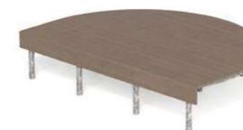
SUNDECKS - 0

Asiento plano modular con forma semiovalada, fabricado con un soporte tubular de acero sobre el que se fijan listones de WPC. El asiento puede utilizarse en composición con los demás elementos de la colección SUNDECKS. Todas las piezas metálicas están galvanizadas. Todos los herrajes son de acero inoxidable AISI304. Predisposición para instalación bajo el suelo o para fijación al suelo con anclajes mecánicos (no incluidos).