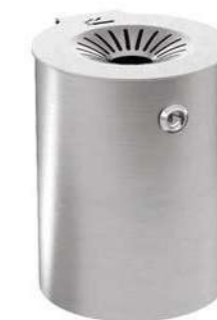
M2 - S

Cigarette bin consisting of a brushed stainless steel tubular container and a wall mounting bracket also made of stainless steel Available with brushed stainless steel container or coated stainless steel container. All fixings are in AISI304 stainless steel. Prepared for wall fixing through mechanical dowels (not included).