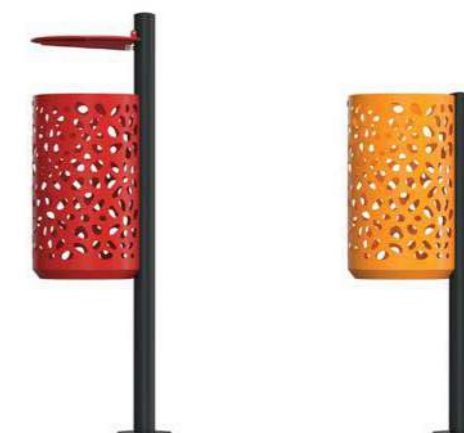
DAISY - C

Prepared with holes for ground fixing through mechanical dowels (not included) or for ingrounding.