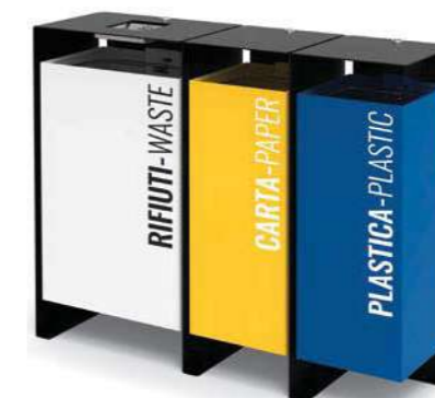
DIVISION 100 lt DIVISION 60 lt

Prepared with holes for ground fixing through mechanical dowels (not included).