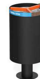
CARROARMATO - REC

Corbeille pour la collecte sélective avec ou sans couvercle, constituée d'une tôle d'acier formant un cylindre avec un support central en tube d'acier.