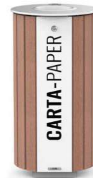
MIANE WOOD 55 lt

Litter bin, available in two sizes, with a cylindrical structure and opening steel lid. Alternatively, a version with a cylindrical structure and hardwood slats is also available. The litter bin is supplied with or without a stainless steel ashtray. The litter bin is equipped with a bag holder. All metal parts are galvanised and coated with thermosetting polyester powder. On request, the litter bin can be supplied with customised graphics for the flat front, which is always supplied with a smooth finish. All fixings are in AISI304 stainless steel. Prepared with holes for ground fixing through mechanical dowels (not included).