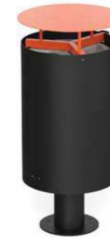
CARROARMATO - CP

Prepared with holes for ground fixing through mechanical dowels (not included).