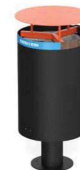
CARROARMATO - CP REC

Prepared with holes for ground fixing through mechanical dowels (not included).