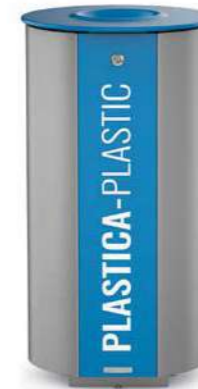
MIANE 80 lt