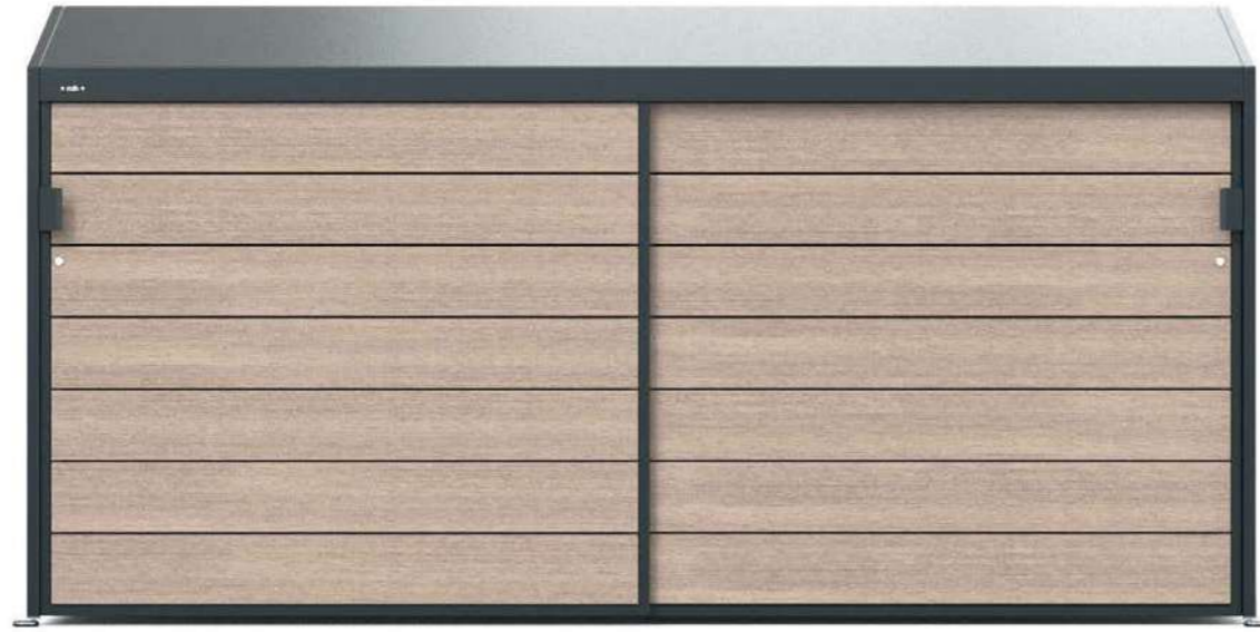
CLEAN 300 - WPC