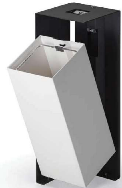
DIVISION 60 lt

DISEGNI / DRAWINGS / PLANS / DIBUJOS: p.430