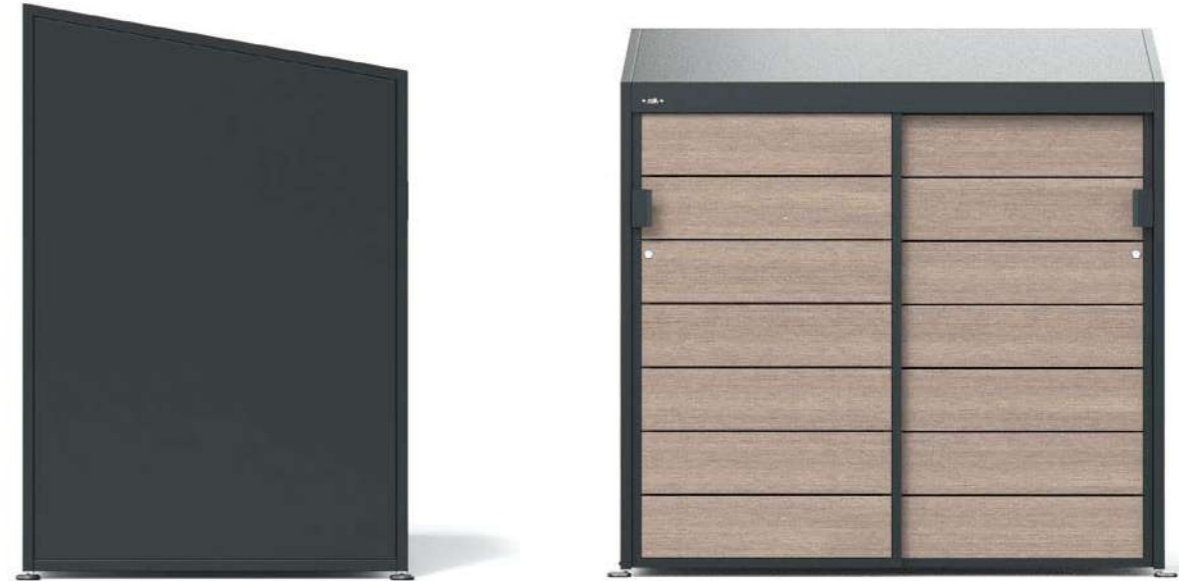
CLEAN 150 - WPC