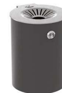
M2 - M

Corbeille à cigarettes composée d'un conteneur tubulaire en acier inoxydable brossé et d'un support mural également en acier inoxydable. Disponibile en acier inoxydable brossé ou en acier inoxydable thermolaqué. Toute la visserie est en acier inoxydable AISI304. Possibilité de montage mural à l'aide de chevilles mécaniques (non incluses).