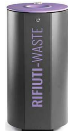
MIANE 120 lt

Corbeille disponible en deux tailles, avec cadre cylindrique en tôle d'acier bordée, avec la partie frontale plate et couvercle ouvrant en tôle d'acier. Une version avec cadre cylindrique en lames de bois dur est également disponible. La corbeille est livrée avec ou sans cendrier en acier inoxydable. La corbeille est toujours équipée d'un anneau porte-sac en acier. Sur demande, la corbeille peut être fournie avec des graphiques personnalisés dans la partie frontale plate, qui est toujours fournie avec une finition lisse. Toutes les parties métalliques sont galvanisées et thermolaquées en poudre de polyester thermodurcissable. Toute la visserie est en acier inoxydable AISI304. Predisposition avec des trous pour la fixation au sol avec des chevilles (non incluses).